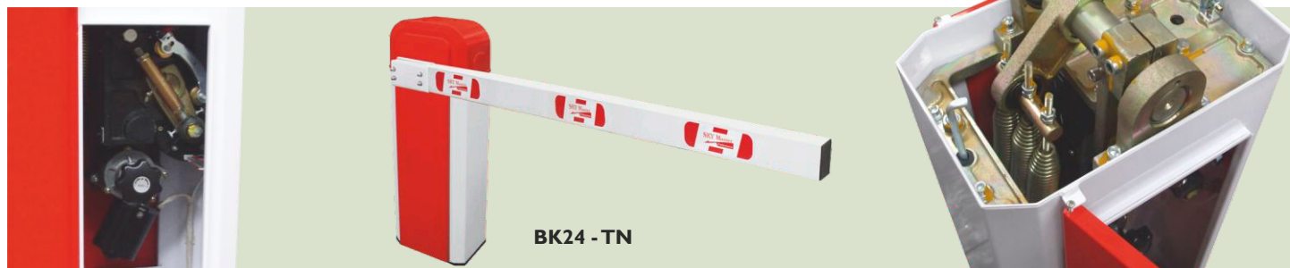
BK24 - TN

Barreira automática para controlo de acessos, com a flexibilidade dos 24V. A escolha certa para cada situação / Barrera automática para control de acceso, con la flexibilidad de los 24V. La elección correcta para cada situación / Barrière automatique pour contrôle d'accès, avec la flexibilité des 24V. Le choix approprié pour chaque situation / Automatic barrier gate for access control, with the flexibility of the 24V. The right choice for every situation